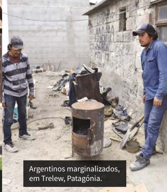
Argentinos marginalizados, em Trelew, Patagônia.