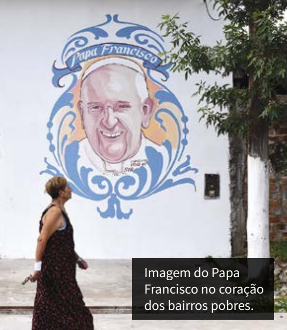
Imagem do Papa Francisco no coração dos bairros pobres.