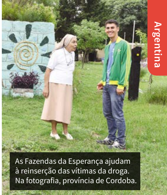
As Fazendas da Esperança ajudam à reinserção das vítimas da droga. Na fotografia, província de Córdoba.